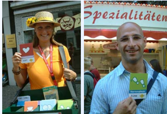
Abb. 1: Campaignerin und Aktionsteilnehmer

Weitere Informationen und Download des Posters: www.konsumwende.de Kampagne: www.futureins.de Mail: koerber@bfoe.de